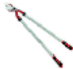
Un sécateur de force