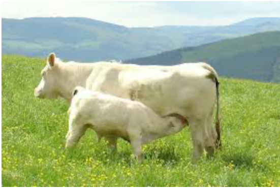
Une vache charolaise et son veau

Nous avons fait des recherches pour connaître la différence entre les deux mots. Eh bien, Christophe Carry est éleveur. Il élève des vaches de race charolaise pour vendre ensuite leur viande à des boucheries. Il est aussi un peu cultivateur car il cultive des céréales uniquement pour fournir de la nourriture à ses bêtes.