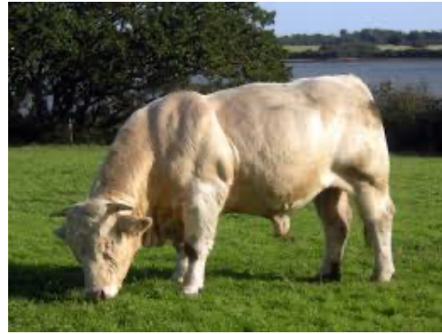
Un taureau charolais

Christophe Carry possède 430 animaux, uniquement des bovins : des taureaux, des vaches et des veaux. C'est beaucoup. Il faut s'en occuper tous les jours. Mais il ne travaille pas seul, il est accompagné par son oncle, un salarié et un stagiaire.