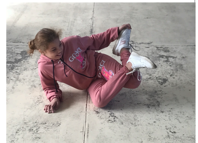
Zorka réalise une figure acrobatique au sol

C'est une danse énergique qui peut correspondre à toutes sortes de musique.