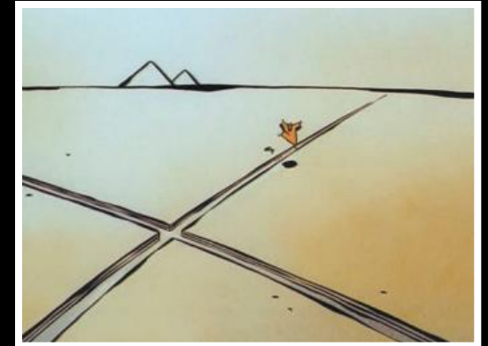
Rentrée des classes