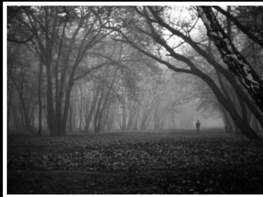
Le hérisson dans le brouillard