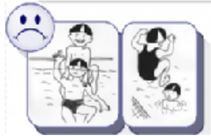
Je n'appuie pas sur la tête des camarades et je regarde où je saute.