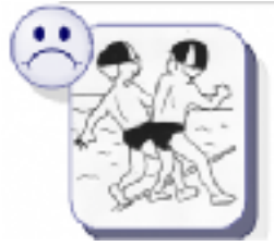
Je ne pousse pas.